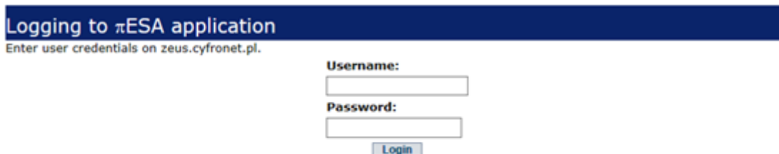
Rys. 1 Widok strony logowania do Platformy \pi ESA.

Dostęp do Platformy \pi ESA odbywa się poprzez aplikację internetową. Widok strony logowania do aplikacji internetowej platformy został przedstawiony na Rys. 1.